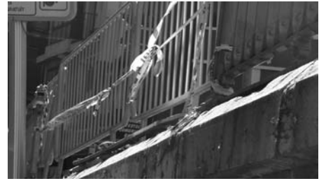
La Tortosa de CIU al 2008