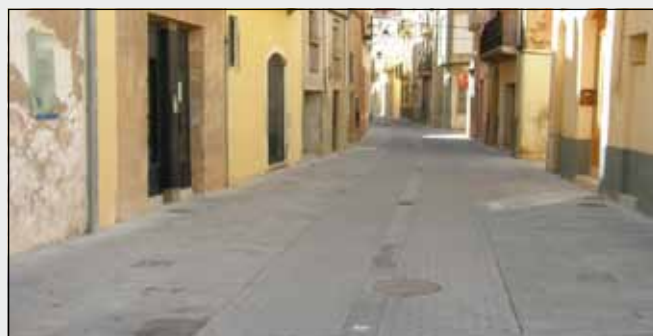
Carrer Major de Remolins