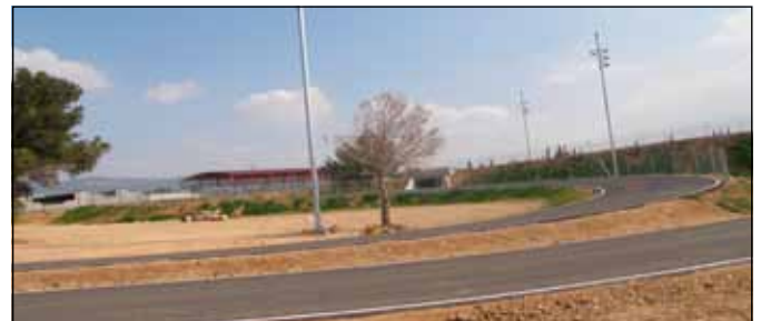
Circuit Ciclista Vinallop