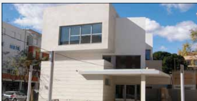
Escola de Música