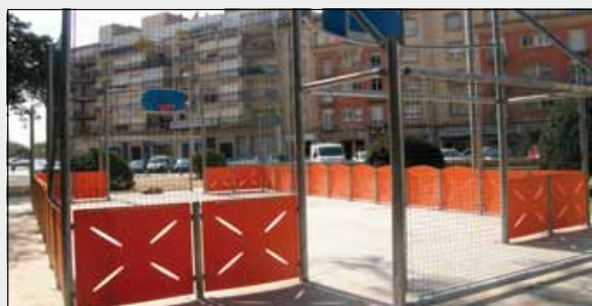
Pista d'street bàsquet