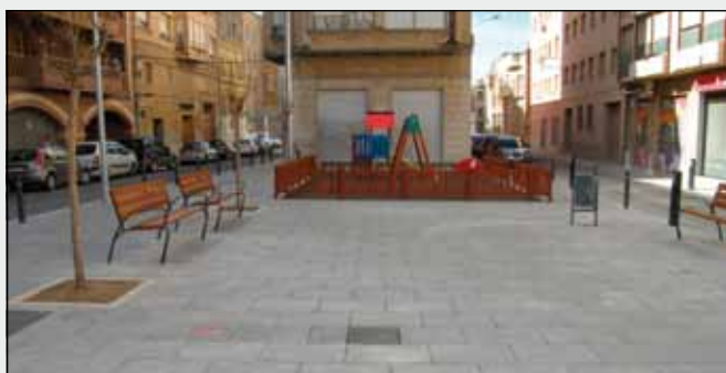
Plaça Pius XII