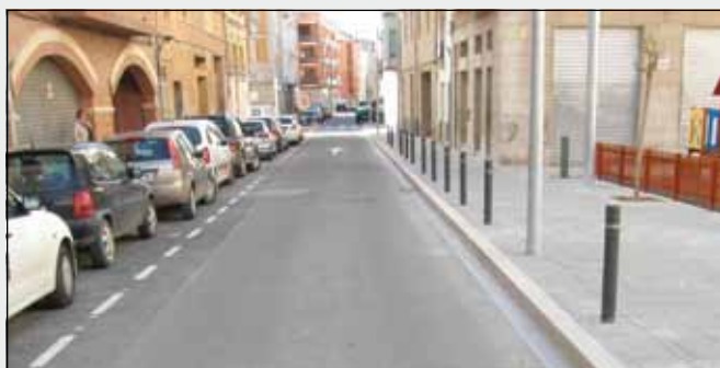
La llarga de Sant Vicent