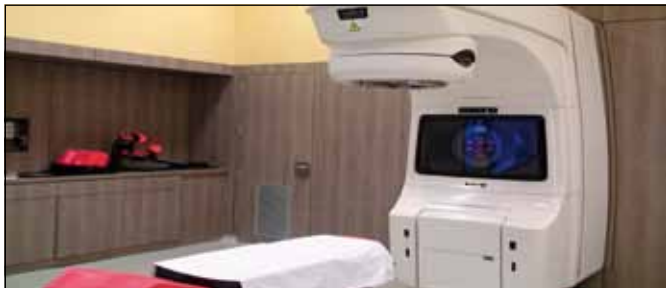
Unitat Radioteràpia Hospital de la Santa Creu de Jesús

Totes aquestes actuacions responen a la voluntat i sensibilitat dels governs i dels socialistes que els presideixen, a favor de Tortosa, per a les persones i no tenint en compte si els que governen són o no afins políticament. Res a veure amb el sectarisme dels governs de Pujol o Aznar, que en el primer mandat socialista a Tortosa (1999-2003) ens varen marginar i ignorar. Gràcies als dos governs i tot el suport dels socialistes tortosins per continuar millorant Tortosa.