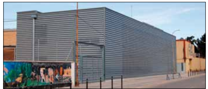
Ampliació IES Joaquín Bau