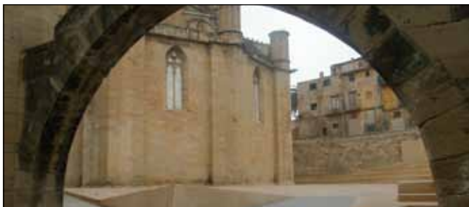
Recuperació del Nucli Antic