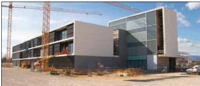
Nova Caserna Mossos d'Esquadra