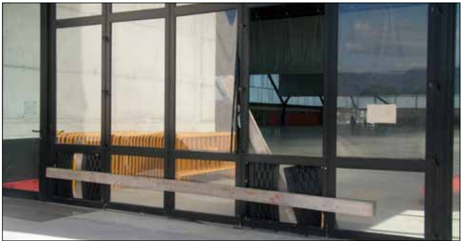
Estat de deixadesa actual del pavelló firal i esportiu

El grup socialista volem denunciar l'estat de deixadesa del pavelló firal per part del govern de Bel. Així mateix, el continuem defensant com un equipament clau no només pel que fa als seus usos firal i esportiu, sinó també perquè exemplifica un model de ciutat basat en un creixement equilibrat. Els socialistes lamentem, a més, que el govern hagi anunciat que pensa reduir el seu ús esportiu. Així mateix, des del PSC considerem incompreensible que en tres anys el govern de Bel no hagi estat capaç de resoldre el problema de l'aigua calenta.