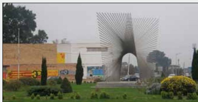
Millora als jardins