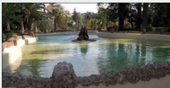
Adequació Parc Municipal