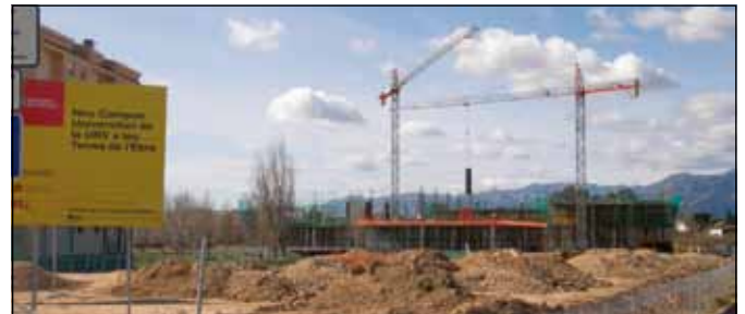
Nou Campus Universitari de les Terres de l'Ebre