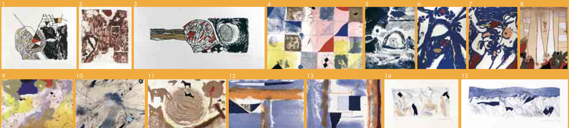
1. Desde la boca-marge (1989) 2. Terra i espais (1989) 3. Cap i camp (1989) 4. Joc a terra (1982) 5. L'amor i l'espina (1986) 6. Figueres (1989) 7. Figueres II (1989) 8. Fang 2 (1982) 9. Cal i blau (1982) 10. Cal i ritme (1982) 11. Terra i memòria (1995) 12. Blaus finestres (2003) 13. Blaus finestres (2003) 14. La joie de vivre (1997) 15. Sin título (1996)

Josep Guinovart Castelldefels, maig de 1995